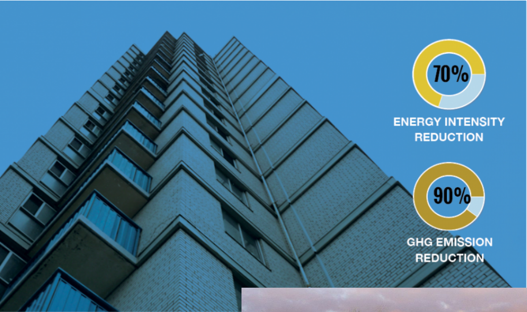
Ken Soble Tower Transformation Project Overview